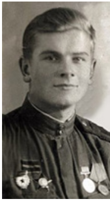
Б.Ф. Федоров (1922–1984)

Произведения Бориса Федорова находятся в музеях и частных собраниях в России, Великобритании, Японии, США, Франции и других странах.