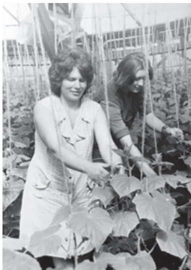
В теплицах совхоза имени Жданова