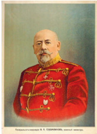
Портрет военного министра генерала В.А. Сухолинова в гусарской форме. Открытка начала XX века