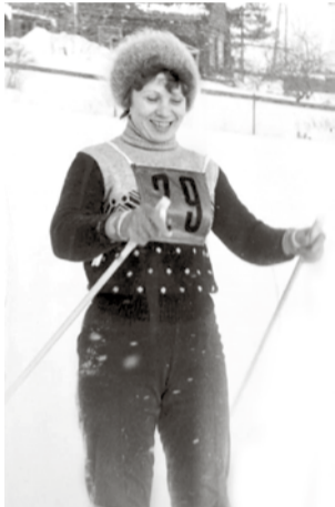
На дудергофской лыжне, конец 70-х гг.