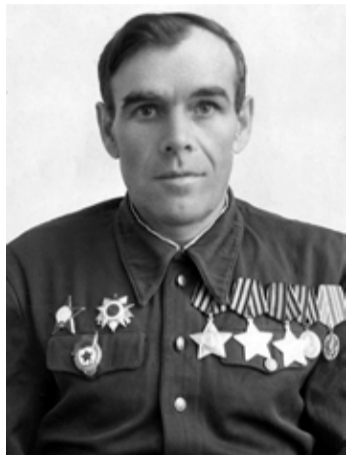
Николай Андреевич Залётов (1914–1977)

В последующие дни 188-й гвардейский стрелковый полк, пройдя с боями от окрестностей современного Малого Карлина до Дудергофского озера, освободил Виллози.