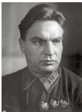
Валерий Павлович Чкалов (1904–1938)

Так ровно 90 лет назад Чкалов простился с дудергофским небом. В дальнейшем Валерий Чкалов выполнил более тысячи испытательных полетов на десятках типов самолетов и навсегда вписал свое имя в историю авиации, совершив вместе с Георгием Байдуковым и Александром Беляковым рекордный перелет из Москвы на Дальний Восток, а также первый беспосадочный перелет через Северный полюс из СССР в США.