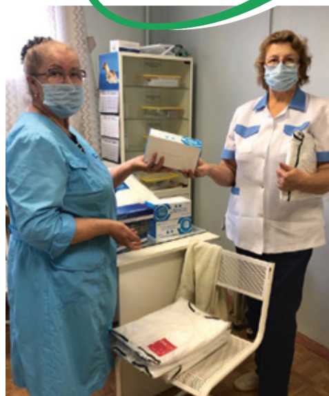
Костюмы, маски и перчатки для медперсонала от Совета депутатов Виллозского городского поселения

По сообщению пресс-службы губернатора и правительства Ленинградской области в регионе усилятся проверки масочного режима. Теперь они будут проходить без предупреждения муниципальных органов власти. Проверяться будут торговые комплексы, магазины, транспорт и другие общественные места. Нарушения масочного режима будут иметь серьезные последствия в виде взыскания штрафов.