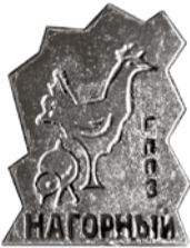
Нагрудный знак ГППЗ «Нагорный»

Путешествие на берега Волхова было коротким, но насыщенным. При выходе из автобуса его участники благодарили организаторов за праздничную поездку, проведенную в непростое для всех время.