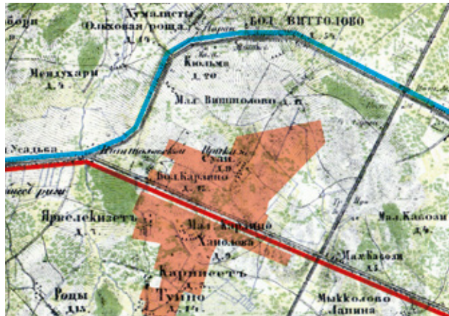
Фрагмент карты 1860 года, на который спроецированы линии старой (голубого цвета) и новой (красного цвета) дорог из Царского Села в Красное Село, а также современные границы д. Малое Карлино

С запуском более мощного Таицкого водовода в конце XVIII века Виттоловский водовод, ветшая, утратил свое исключительное значение. А в середине XIX века в России наступило время интенсивного шоссеинного и железнодорожного строительства и магистраль Виттоловского водовода была пересечена Киевским шоссе и Варшавской железной дорогой.