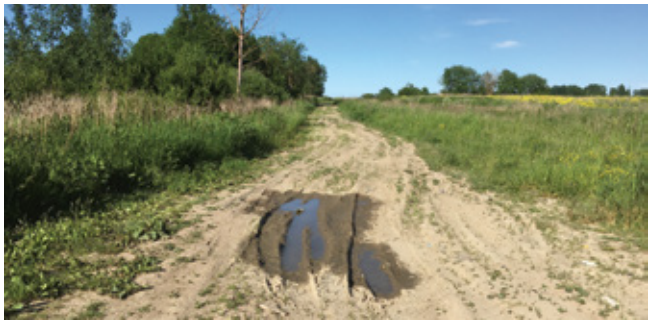
Участок бывшей «виттоловской» дороги из Царского Села в Красное Село (июнь 2020 года)