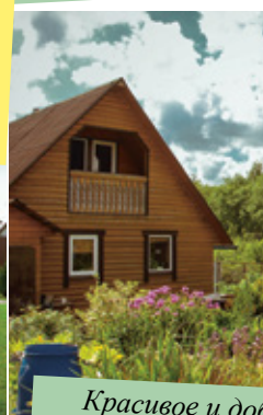
Красивое и добротное хозяйство семьи Лебедевых (СНТ «Самсон»)