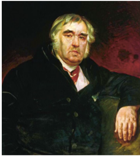
Портрет работы К.П. Брюллова

Выйдя в отставку, отец Ивана Андреевича поселился с семьей в Твери. После