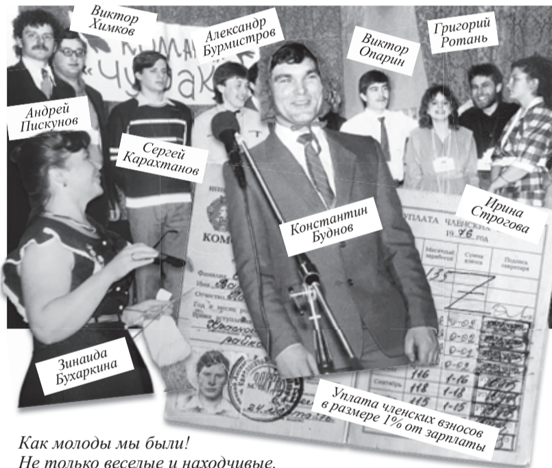
Как молоды мы были! Не только веселые и находчивые, но и дисциплинированные комсомольцы совхоза им. Жданова

Член ВЛКСМ обязан... содействовать укреплению дружбы народов СССР, братских связей советской молодежи с молодежью стран социалистического содружества, с пролетарской трудящейся и учащейся молодежью мира. (Из Устава ВЛКСМ)