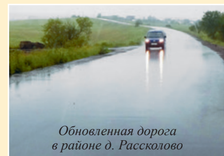
Обновленная дорога в районе д. Рассколово

Среднегодовая интенсивность прохождения по этой трассе составляет около 2500 автомобилей в сутки. По графику работы должны быть завершены к середине августа, но, учитывая значение дороги для жителей поселения, ее ремонт выполняется в максимально сжатые сроки.