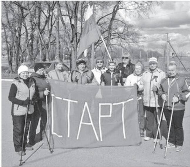
Члены секции скандинавской ходьбы – участники традиционного похода, посвященного Дню Победы, перед стартом у ДК Виллози

Скандинавская ходьба с 2017 года включена в перечень испытаний комплекса ГТО для людей старшего поколения. 21 мая в Нижнем парке Пушкина состоялся «Цар-