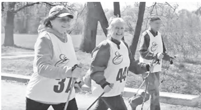
На трехкилометровой дистанции «Царскосельского фестиваля скандинавской ходьбы»