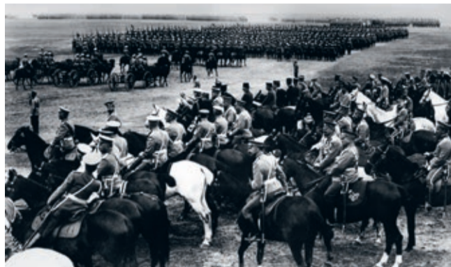
Парад войск в Красном Селе. 30 июля 1912 г.

сегодня без всякой натяжки можно сказать, что именно на этом месте, где демонстрировалась мощь державы, строилась большая политика Российского государства.