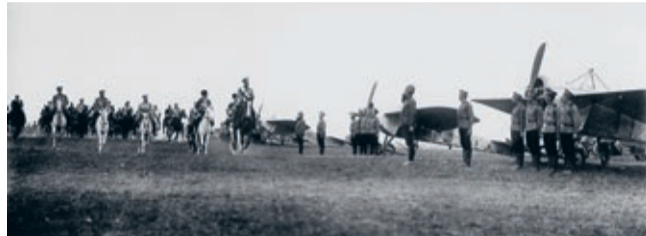
Николай II со свитой на авиационном параде в Красном Селе. 1913 г.

Изменения в способах ведения войн приводили к изменению уставов, и во время маневров проводилась их первичная апробация. Таким образом, Красное Село стало «учебно-методическим центром полевой подготовки» для русской армии, что не случайно, ведь, помимо гвардейских частей – неперенных участников всех маневров, на лагерный сбор каждый год командировались соединения и части всех родов войск. Кстати, изменение качественных характеристик оружия, в первую очередь дальности, заставляло несколько раз изменять конфигурацию уже существующих стрельбищ. Но испытывали не только огнестрельное оружие. Здесь проверяли жизнеспособность технических новинок и их надежность для армии. Были проведены испытания самолета А.Ф. Можайского, самокатов (так назывались велосипеды) и первых русских броневых автомобилей, была опробована радиосвязь в качестве средства управления войсками.