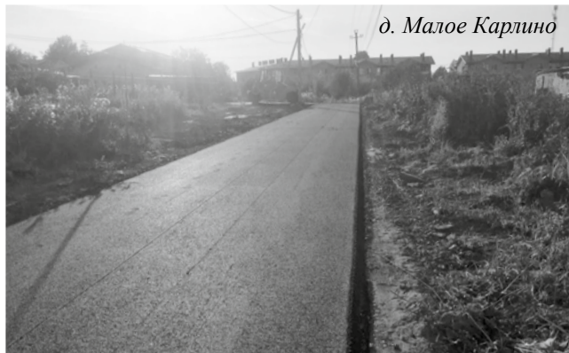
д. Малое Карлино

■ Хорошие новости от администрации Виллозского поселения есть не только для автомобилистов, но и для пешеходов: в д. Аропаккузи появился тротуар длиной 840 метров!