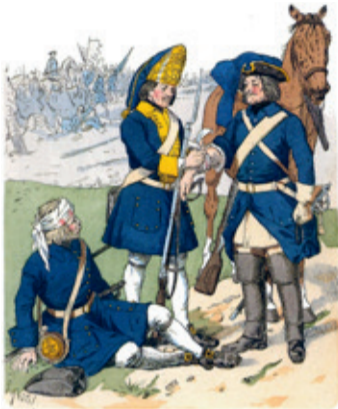
Солдаты шведской армии времен Северной войны