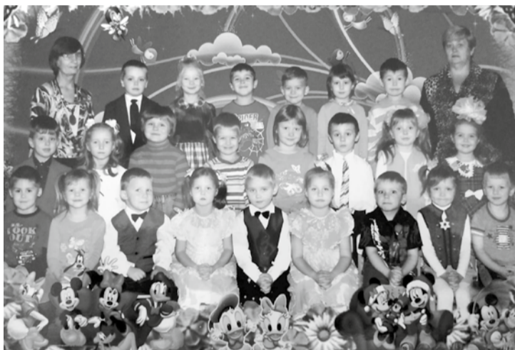
Старшая группа детского сада № 52, пос. Можайский, 2008 год

дут целый грецкий орех или гальку – кому это потом попадется, тому в жизни будет счастье!