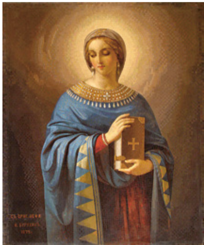
Мозаика И.Д. Бурухина «Великомученица Анастасия Узорешительница» Исаакиевский собор, СПб

А смальта отличается немеркнувшей цветоносностью и долговечностью – неспроста мозаику называют «вечной живописью».