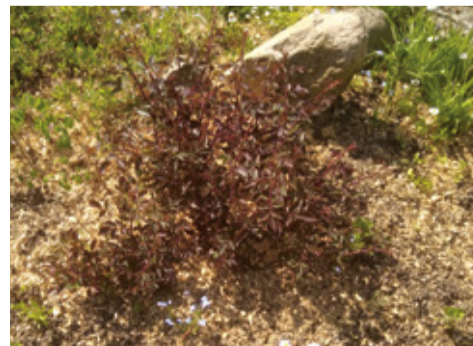
Через полторы недели

те объем до 10 литров. Этим раствором полейте все пострадавшие и обрезанные розы – по 3-4 литра под куст. Потом обработанные пенки советуют накрыть обрезанной 5-литровой емкостью, но я не накрывала. Через две недели процедуру