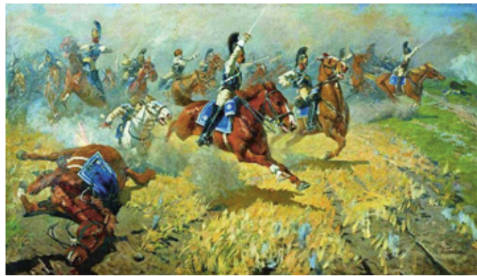
Атака лейб-гвардии Кирасирского его величества полка Худ. М. Греков

Авангард атакует на много превосходящими силами противника и вынужден отступать. Отход авангарда прикрывает своими контратаками дивизия легкой кавалерии в полном составе, так как «неприятель нападает с величайшей силой».